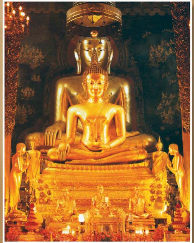
ภาพพระพุทธรูปชินสีห์และพระสุวรรณเขต ในพระวิหารวัดบวรนิเวศวิหาร